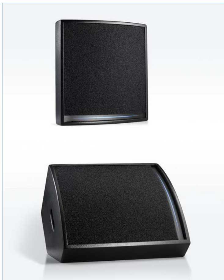
Enceinte DS12S présentée en façade

APG préconise l'emploi des "subwoofers" SUB138P /PS, SUB138 /S ou SUB238S et TB218S.