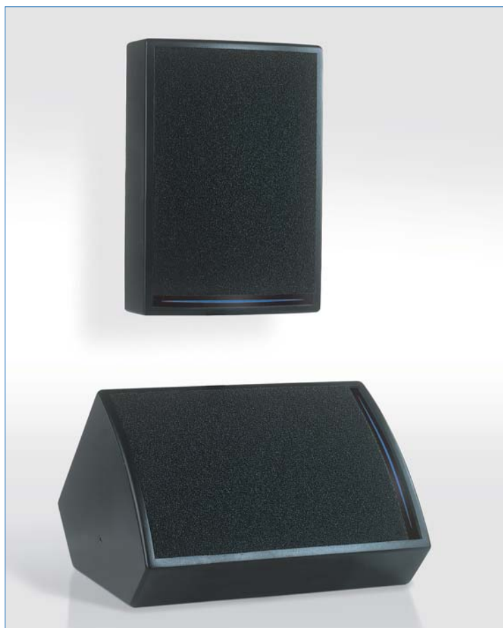
Enceintes MC2 présentées en façade et en retour de scène

APG préconise l'emploi des "subwoofers" SUB138P/PS, SUB138/S ou SUB238S.