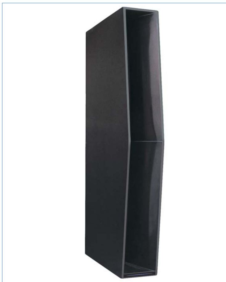
Une enceinte SECTOR SC20

Dans ce cas APG préconise l'emploi des "subwoofers" SUB138/S, SUB146/S ou SUB238S.